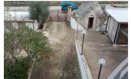
1. Umbau 2017 - vorher

5. Wasser/Stromleitungen für spätere/weitere Umbauarbeiten wurden schon vorbereitet.