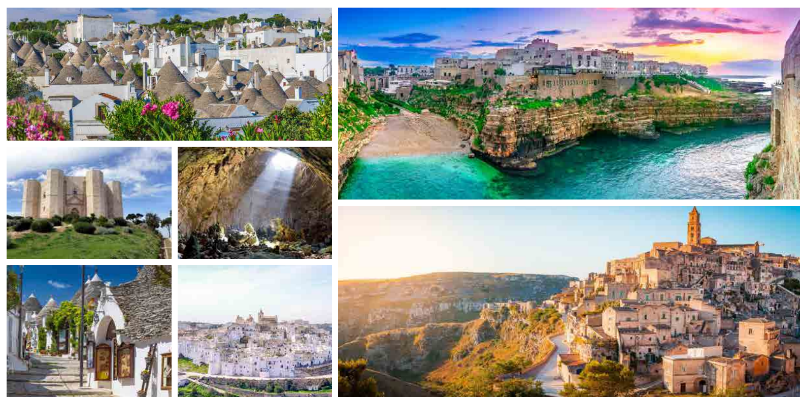
Trulli di Alberobello, Polignano a Mare, Castello d. Monte, Grotte di Castellana, Alberobello, Ostuni, Matera