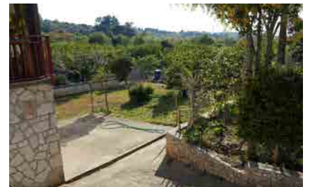
1. Umbau 2017 - nachher